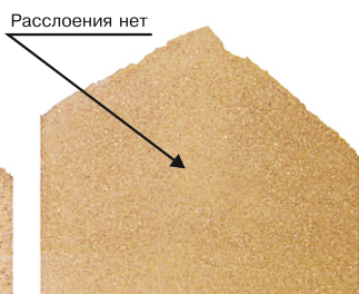
Премикс, произведенный по технологии псевдокапсулирования