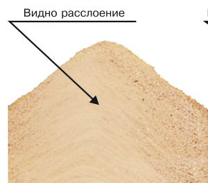
Премикс, произведенный по технологии простого смешивания

До попадания псевдокапсулы в пищеварительную систему, ее содержимое меньше контактирует с влагой и кислородом, содержащимися в воздухе. Это позволяет сохранить в полном объеме витамины, микро и макроэлементы, необходимые для раскрытия генетического потенциала поголовья.